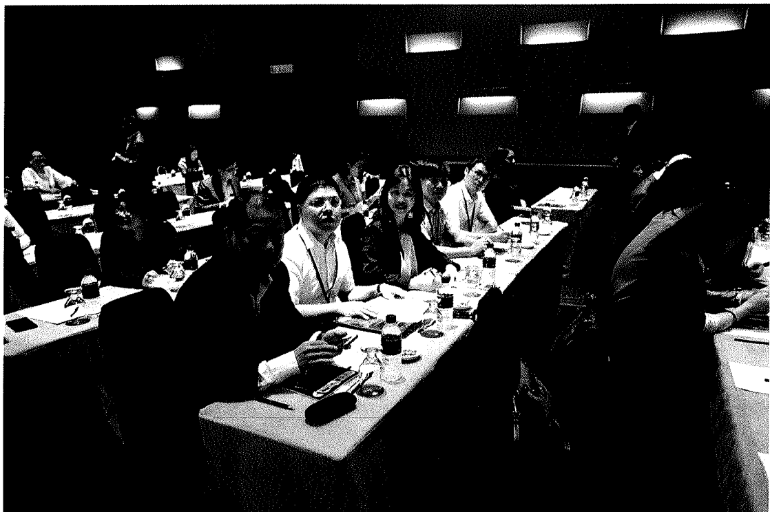
圖二：團員參加第 10 屆亞洲犯罪學年會情形