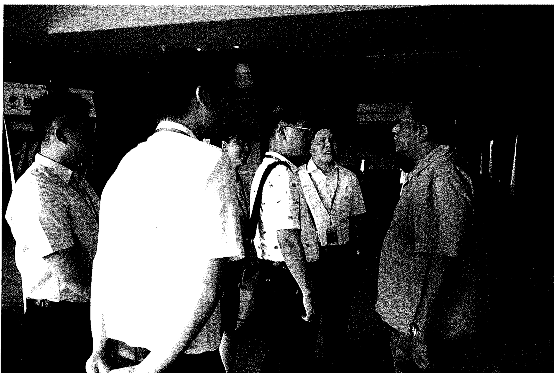
圖三：團員與亞洲犯罪學年會第 10 屆主席 P. SUNDRAMOORTHY 博士合影