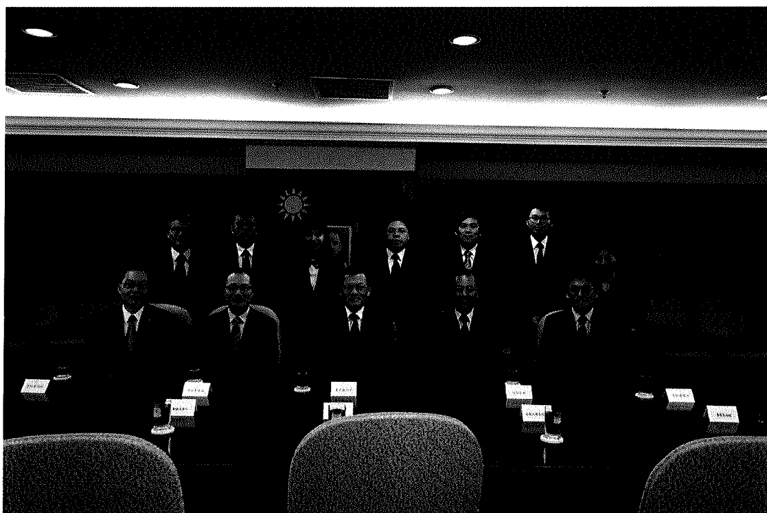
圖七：團員與駐馬來西亞臺北經濟文化辦事處大使及官員合影