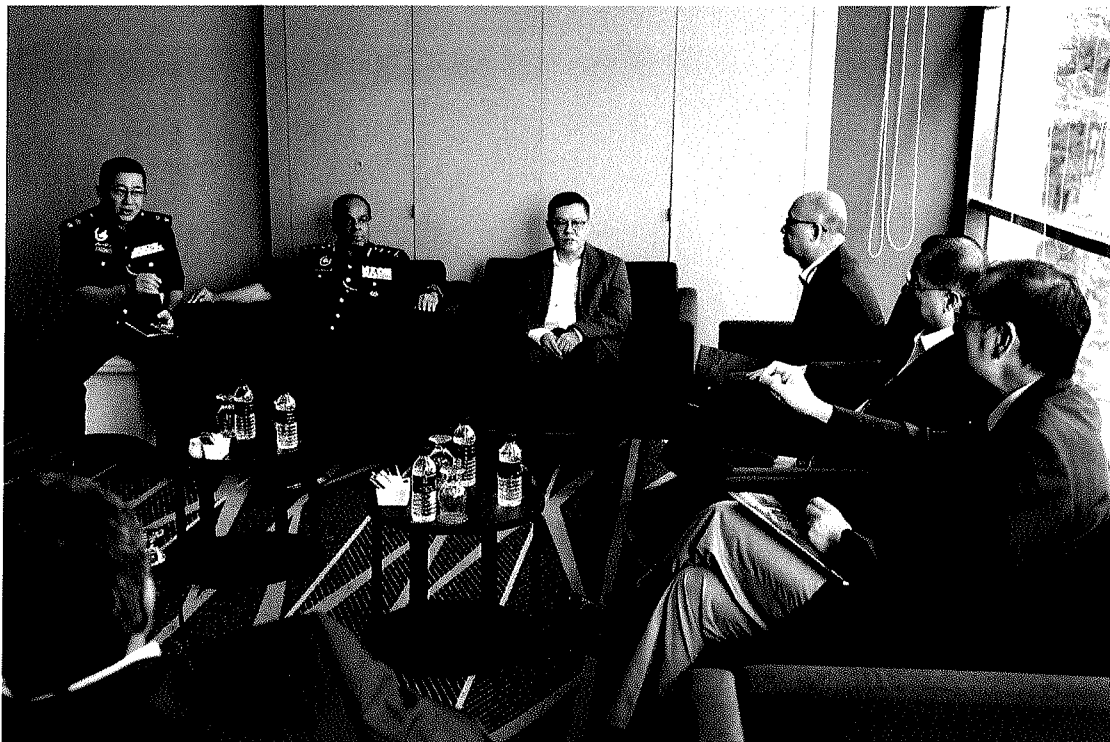
圖五：與檳城預防犯罪和社區安全全部高級助理警察總監 SAC Dato' Mohamad Anil Shah(左 2)會談