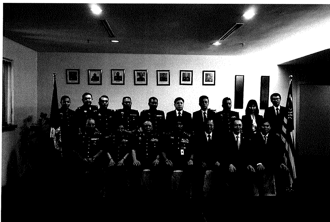
圖十二：團員與馬來西亞皇家警察總部商業犯罪調查局人員合影