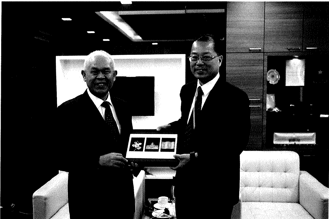
圖十：馬來西亞皇家警察總部肅毒局局長致贈本局禮品