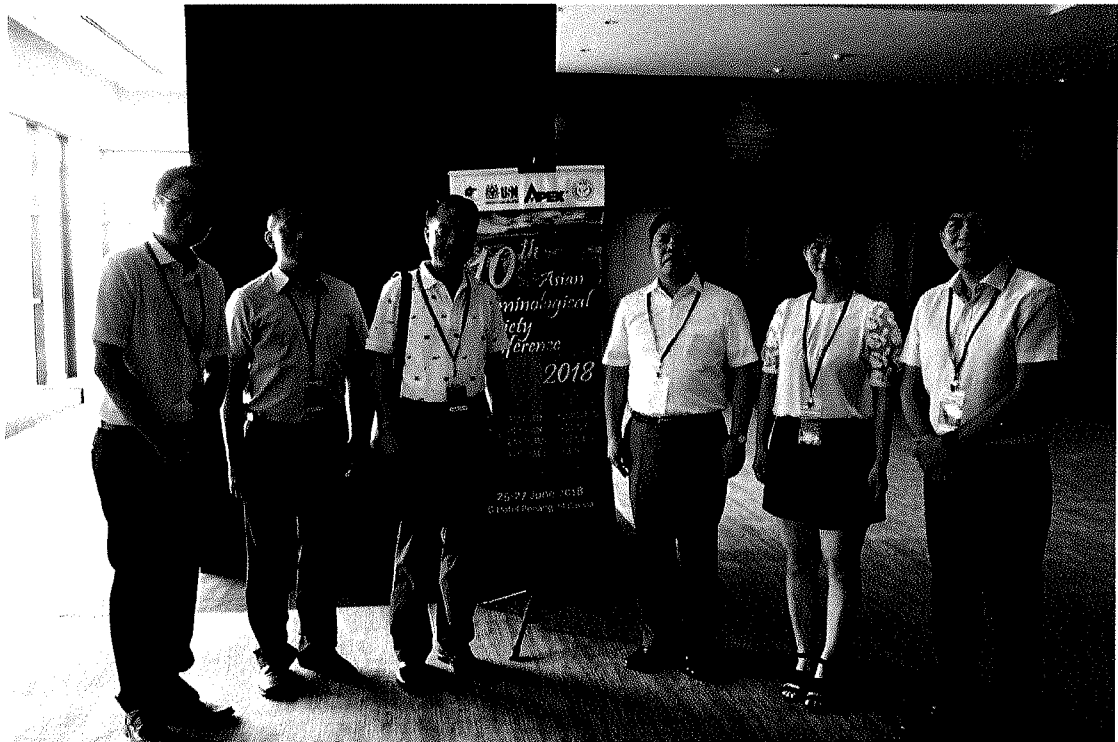
圖一：團員於第 10 屆亞洲犯罪學學會年會會場外合影