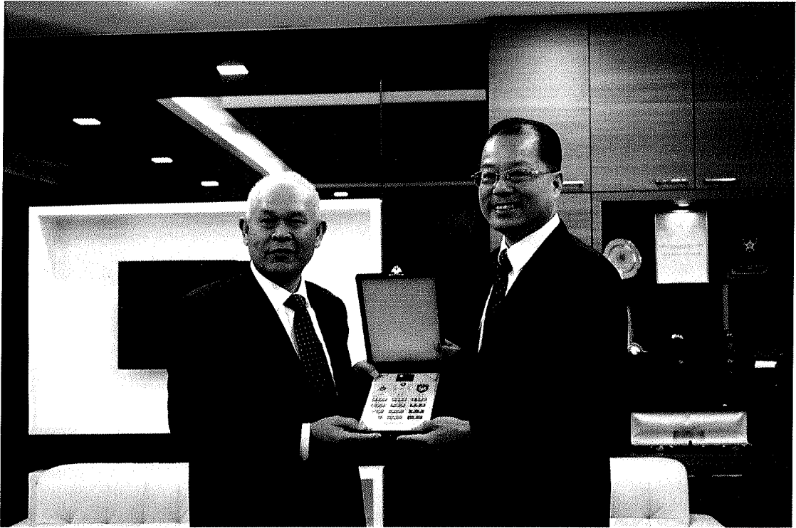
圖九：局長致贈馬來西亞皇家警察總部肅毒局局長禮品