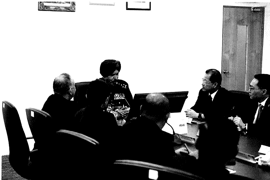
圖十一：馬來西亞皇家警察總部商業犯罪調查局簡報及座談