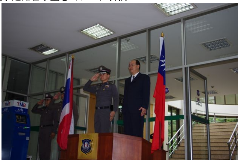
圖二、至泰國曼谷肅毒局參訪