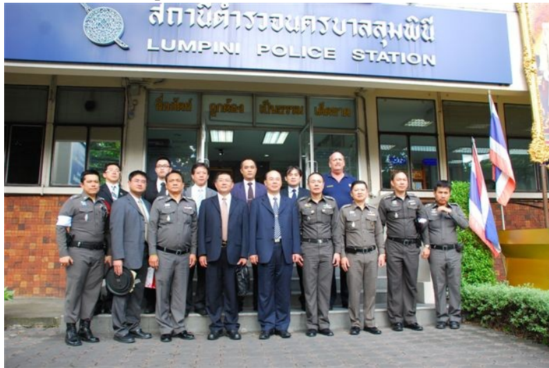
圖十一、曼谷市警察局第五局副局長 Varavudh Thavichaigarn 警特別上校(右四)、LUMPINI 派出所所長 Chanin Vachirapaneekool 警上校(右三)及派出所幹部合影