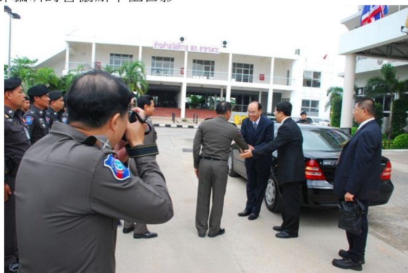
圖六、至觀光警察局參訪