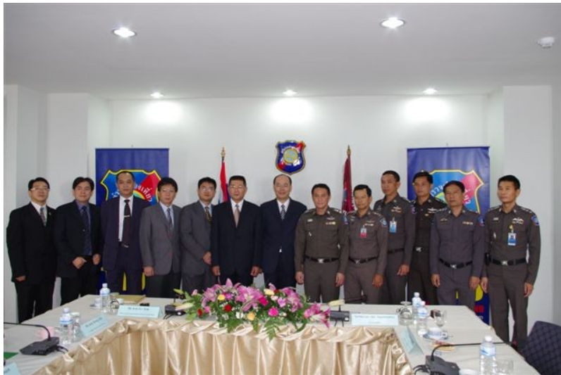
圖七、與觀光警察局局長 Adis Ngamchitsuksri 警少將(右六)、副局長 Supapone Arunsit 警上校(右五)等幹部合影