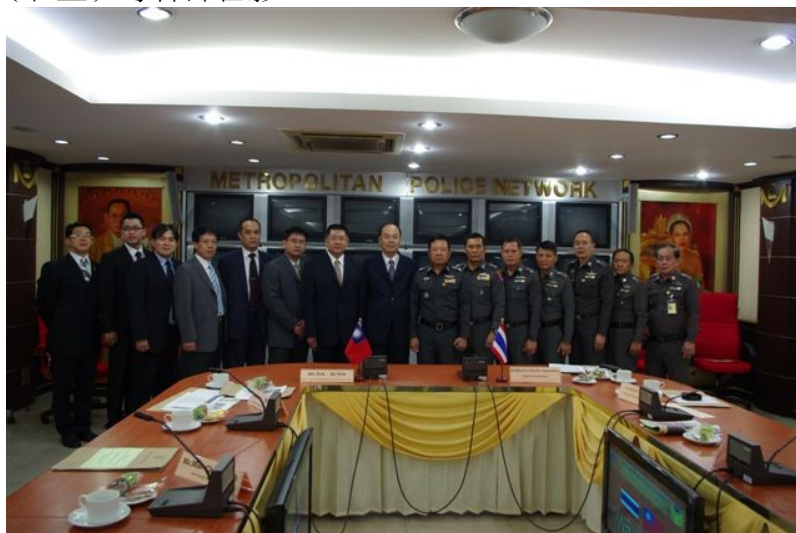
圖八、與曼谷市警察局副總局長 Anuchai Legbumrung 警少將(右七)、第五局副局長 Varavudh Thavichaigarn(警特別上校)等幹部合影