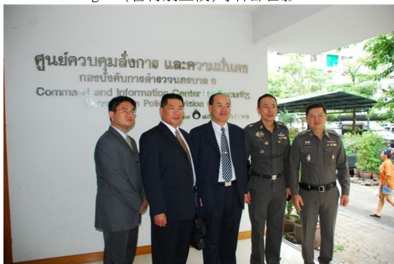
圖九、與曼谷市警察局第五局副局長 Varavudh Thavichaigarn 警特別上校(右二)、LUMPINI 派出所所長 Chanin Vachirapaneeekool 警上校(右一)等幹部合影