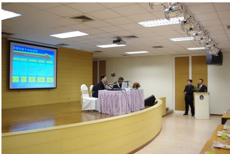
圖四、參加泰國皇家警察總署主辦之跨境電信詐騙研討會