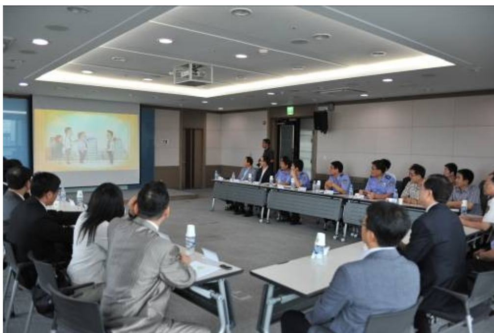
圖十、與「平澤海洋警察署」、「平澤警察署」、「平澤港灣廳」 及「平澤關稅廳」進行多方交流會談情形。