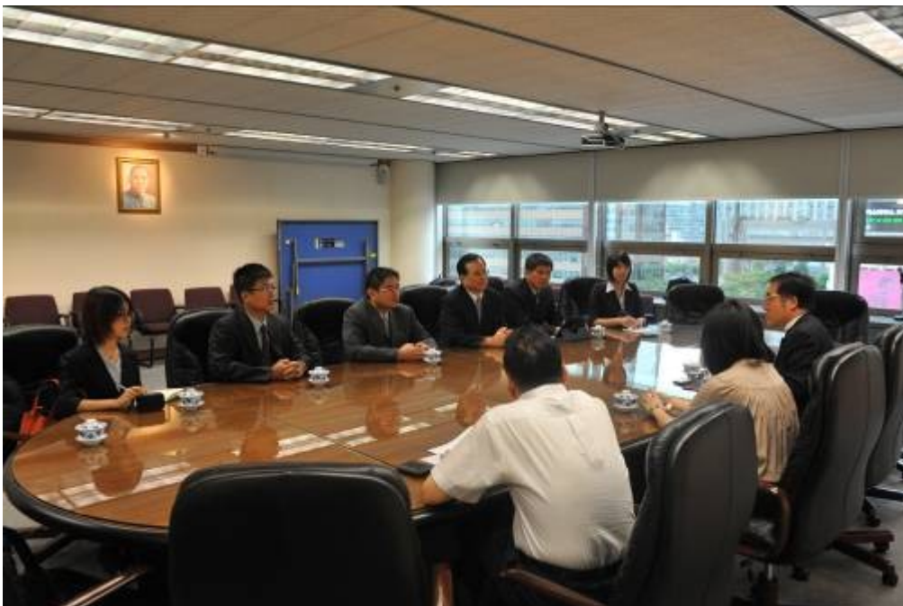
圖二、與代表部人員進行會談之情形。