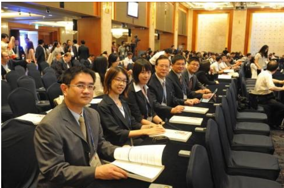
圖六、參與第 4 屆亞洲犯罪學年會(ACS)議程。