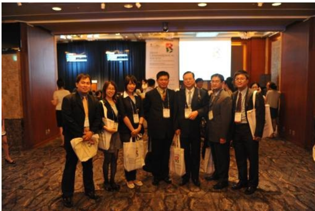
圖四、參加第 4 屆亞洲犯罪學年會(ACS)開幕典禮。