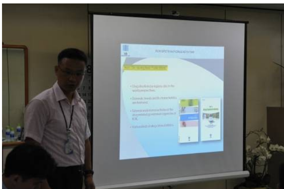
圖八、國際麻藥課陳搜查官向本局進行簡報情形。