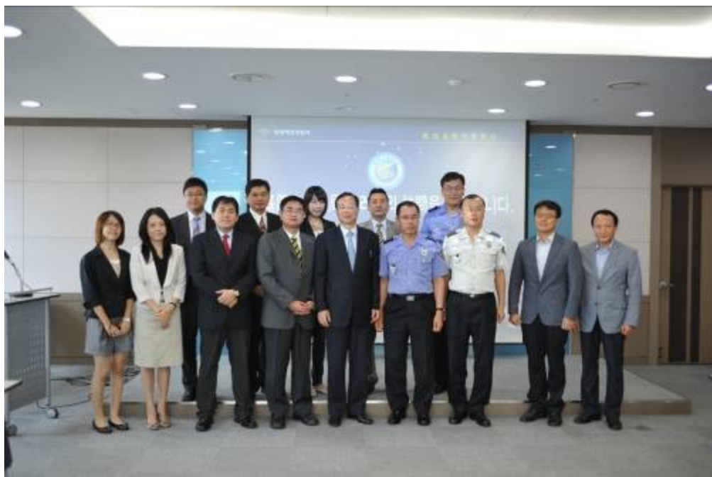
圖十二、與代表部人員、平澤各單位首長合影。