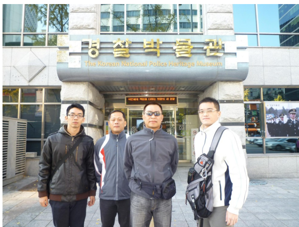
圖六、考察人員於首爾警察博物館前合影