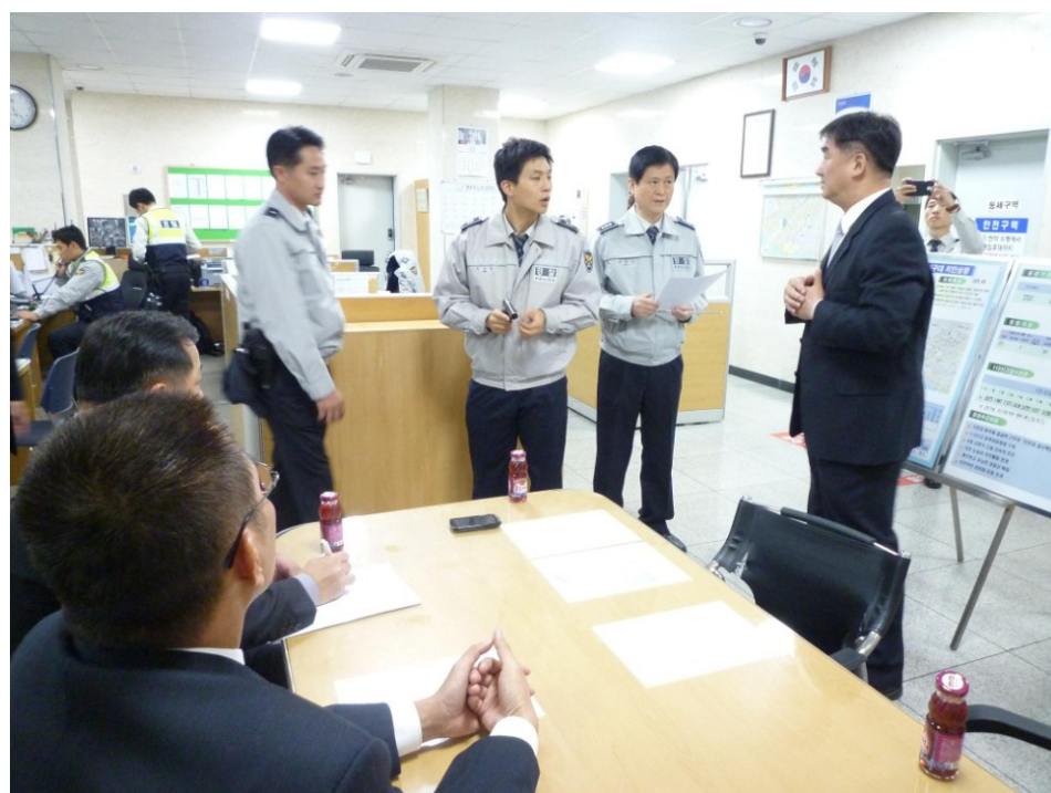
圖四、首爾麻浦警察署弘益地區隊隊長向考察人員簡報情形