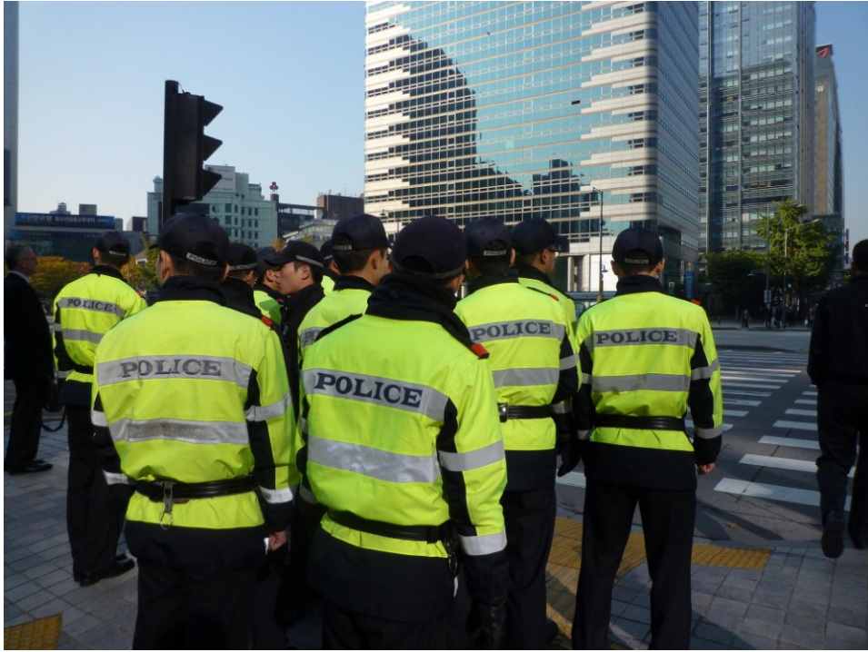
圖七、員警於光化門廣場集合準備前往處理聚眾活動