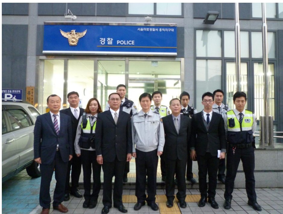
圖五、考察人員與首爾麻浦警察署弘益地區隊隊長等人合影